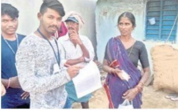
వివరాలు సేకరిస్తున్న ఎన్ఎస్ఎస్ వలంటీర్లు