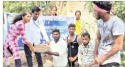
ఇంకుడు గుంత తవ్వతున్న వలంటీర్లు