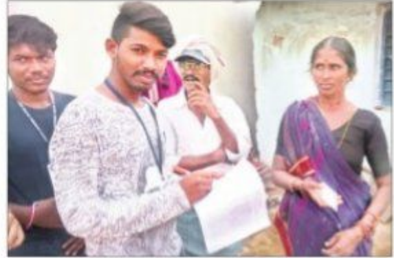
సర్వే నిర్వహిస్తున్న వలంటీర్లు

కమలాపూర్: మండలంలోని అంబాలలో గత ఐదు రోజులుగా హన్మకొండ ప్రభుత్వ కళాశాల ఎన్ఎస్ఎస్ విభాగం ఆధ్వర్యంలో నిర్వహిస్తున్న ప్రత్యేక శిబిరంలో భాగంగా శుక్రవారం ఎన్ఎస్ఎస్ వలంటీర్లు గ్రామంలో సామాజిక, ఆర్థిక సర్వే నిర్వహించారు. ఈ సందర్భంగా ఐదుగురు వలంటీర్లు ఒక బృందంగా ఏర్పడి బాల కార్మికులు, బడి మానేసిన పిల్లలు, గ్రామస్తుల కుటుంబ ఆదాయం, ప్రధాన జీవనాధారం, వృత్తి, వ్యక్తిగత మరుగుదొడ్ల వినియోగం, ప్రభుత్వ పథకాల లబ్ధి తదితర అంశాలకు సంబంధించిన వివరాలు సేకరించారు. ఈ సమాచారాన్ని ప్రణాళికా శాఖకు పంపనున్నట్లు ఎన్ఎస్ఎస్ ప్రోగ్రాం అధికారి